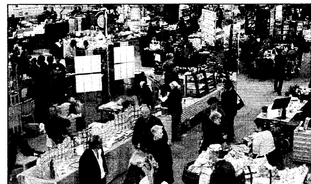
Exposants, conférenciers, ateliers... le salon Bio a occupé toute la surface du complexe sportif.